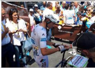
Lors de leur échauffement, les coureurs ont pris le temps de signer quelques autographes. Comme ici Pierre Latour.