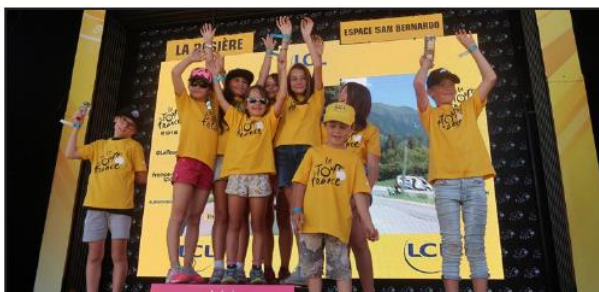
Les écoliers de La Rosière, vainqueurs de la Dictée du Tour, ont été applaudis par le public, pour leur plus grand bonheur.