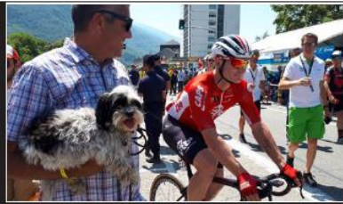
Le champion allemand, André Greipel, a pu compter sur de nombreux supporters... de tous poils !