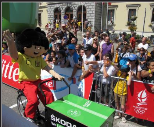
La mascotte d'Haribo a été particulièrement acclamée par les gourmands qui patientaient derrière les barrières.

Sous un soleil écrasant, les passionnés de vélo en ont pris plein les yeux. Hier, des milliers de personnes ont bravé la chaleur (et les travaux) pour prendre part à la grande fête du Tour de France. Après 2012 et 2016, la cité olympique a accueilli un nouveau départ d'étape de la Grande Boucle. Et encore une fois, la réussite a été totale. Au fil de la matinée, la foule des visiteurs a pris de l'ampleur. Des passionnés évidemment. Mais aussi beaucoup d'enfants venus approcher les champions. La chasse à l'autographe et au selfie n'a pas connu de répit. Bien sûr, les Français - Bardet, Latour, Alaphilippe, Chavanel, Galopin... - ont reçu la majorité des encouragements. Au contraire de Christopher Froome qui a essuyé quelques huées lors de sa présentation sur le podium. Pas de quoi gâcher la fête. Lors du départ, à 14 heures, une foule dense, venue de toute France, a poussé le peloton vers le Beaufortain. Le Tour est passé, la foule s'est dispersée et Geraint Thomas a gagné. Désormais, Albertville se prend à rêver d'un nouveau passage du Tour dans les prochaines années.