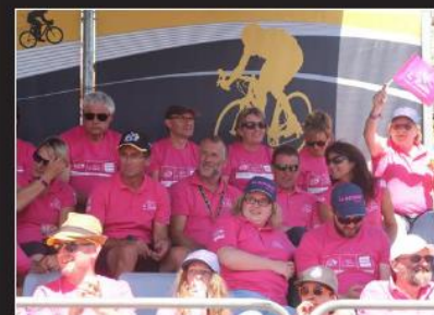
À La Rosière, le rose était de rigueur. C'est la couleur de la station, qui n'a pas manqué de distribuer des t-shirts de cette couleur sur la ligne d'arrivée.