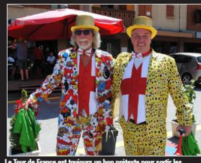
Le Tour de France est toujours un bon prétexte pour sortir les déguisements et costumes les plus farfelus.