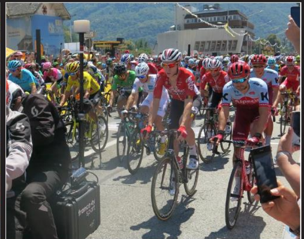
Le départ des coureurs a été accompagné par les encouragements du public qui s'était rassemblé pour saluer les champions...