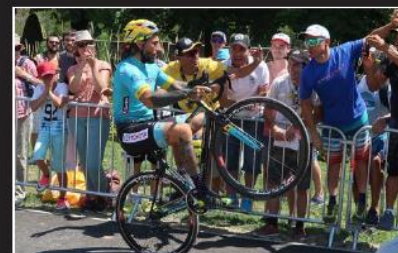
Star des réseaux sociaux et du web, spécialiste du VTT trial, Vittorio Brumotti n'est en lice sur le Tour par Astana. Mais l'italien était au départ et a gratifié le public de quelques-unes des acrobaties qui ont fait sa popularité.