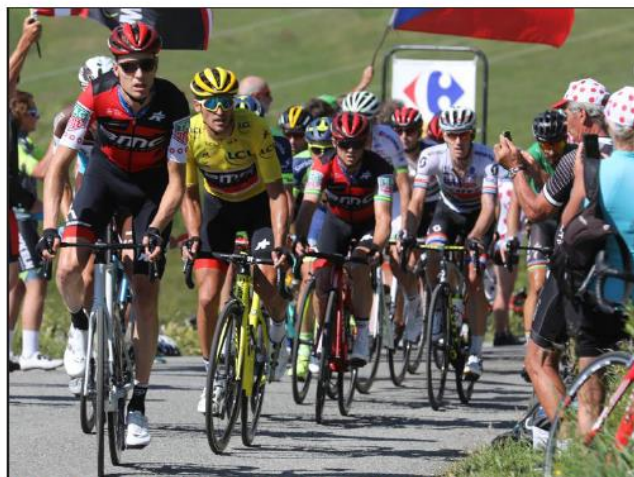
Greg Van Avermaet a affronté le dernier col avec le maillot jaune sur les épaules mais il l'avait déjà perdu. Compréhensifs et respectueux de ces performances, le public l'a acclamé.