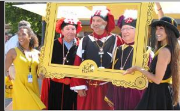
La compagnie du Sarto d'Albertville-Ugine était aussi de la fête avec leurs costumes rappelant celui de l'ancien Sénat de Savoie.