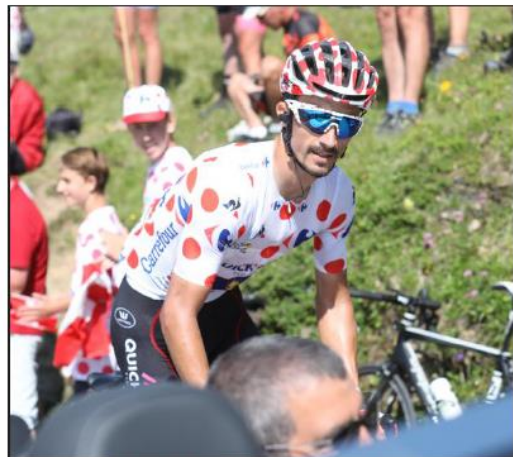
Les spectateurs attendaient Julian Alaphilippe, le vainqueur de l'étape de mardi. Hier, en souffrance, il les a émus et a récolté de gros encouragements.