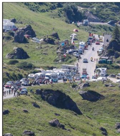
Au plan de la Laie, des dizaines de camping-cars et campeurs s'étaient installés depuis plusieurs jours, dans un cadre de rêve.