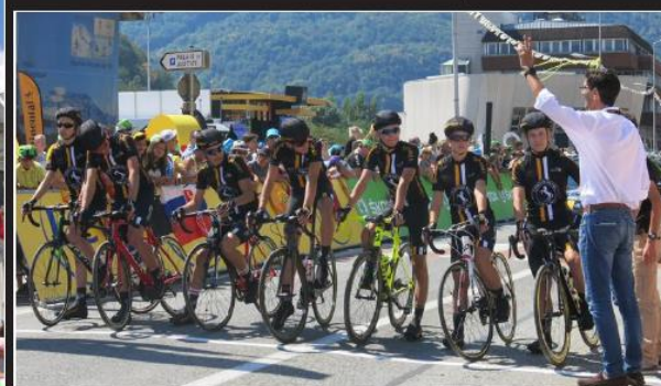
Le départ des Cadets du Tour a été donné par le maire. Les huit cadets, affiliés à l'Olympique cyclisme Albertville et au Guidon d'or de la Leclère, ont parcouru les 30 premiers et les 30 derniers kilomètres de l'étape et ont été conviés à suivre l'arrivée des pros en tribune VIP.

La mairie s'était mise aux couleurs du Tour avec ce maillot jaune accroché sur la façade.