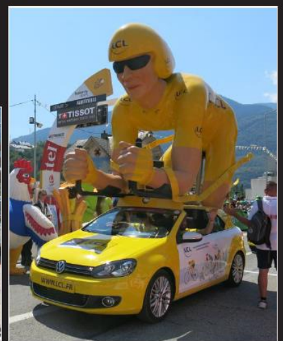
La caravane du Tour a défilé devant l'hôtel de ville pendant que les mascottes distribuèrent porte-clés, casquettes et bonbons à la volée. L'occasion de repartir avec un souvenir.