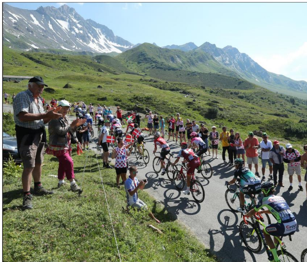
Au dernier kilomètre du Cornet de Roselend, les spectateurs ont patiemment dans la bonne humeur, suivant la course à la radio ou à la télévision dans les camping-cars, jusqu'à 16 h 30 pour applaudir le peloton.