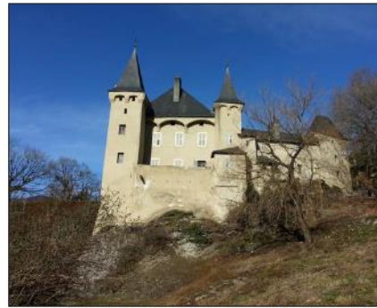
La maison forte de Costaroché a été construite par la famille de Locatel entre 1579 et 1583, afin de protéger Conflans des attaques françaises.

Prochaines visites aujourd'hui et 26 juillet, à 10 h 30 et 16 h, et dimanche 29 juillet à 15 h. Inscriptions indispensables au : 04 79 37 86 86 (nombre de places limité). Tarifs : 5 € ; 2,50 € (12-18 ans, étudiants, chômeurs et plus de 65 ans) ; gratuit pour les moins de 12 ans.