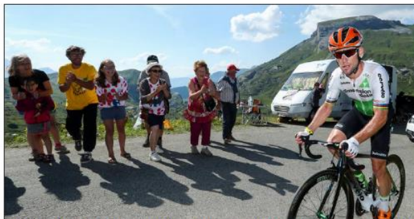
Avant de partir, hier soir, les Carcenac et un groupe de passionnés ont attendu jusqu'au passage du tout dernier, Mark Cavendish qui est arrivé hors délai à Bourg. Les chasseurs alpins du 7 e BCA ont affiché leurs couleurs pour fêter le 130 e anniversaire des troupes de montagne.