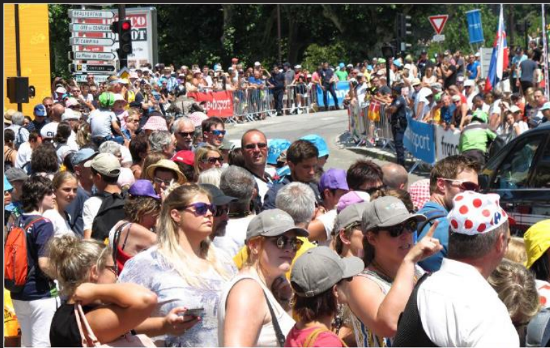
A quelques secondes du départ, une foule dense était massée entre la mairie et le pont des Adoubes.