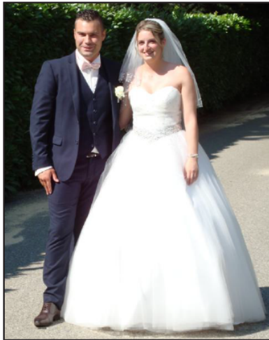
Les mariés et leurs familles sont particulièrement investis dans la vie associative.