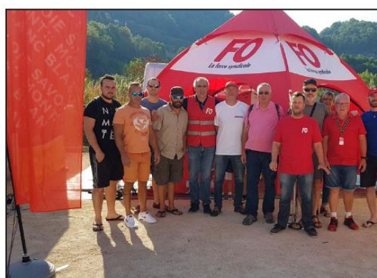
À Albertville, comme à Bourg-Saint-Maurice, le syndicat Force ouvrière a profité de l'exposition médiatique du Tour de France pour aborder de quelques sujets.

prochaines années. Association FO des consommateurs y présentera des listes afin d'accompagner et défendre les locataires et le logement social dans les différentes instances.